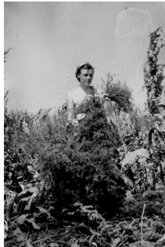
На острові Орлів в Чорно- номорському заповіднику, середина 60-х років