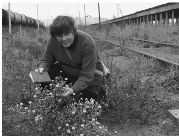
Експедиція на Буковину, на залізничній станції Вадул-Сирет Чернівецької обл.) знахідка Brachyactis ciliata (Ledeb.) Ledeb., 2007