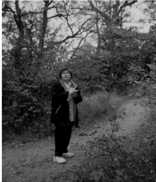
Експедиція в Крим, заповідник Мис Март'ян, 2004