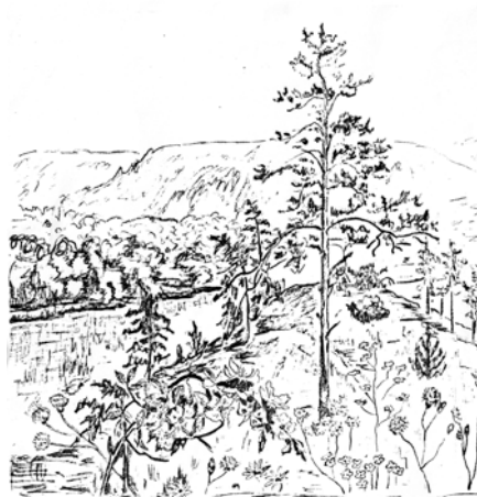
З польового щоденника (Святі гори Донецької обл.), 1958