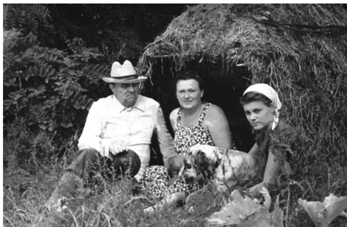
З батьками на дачі в с. Юрки (середина 50-х років)