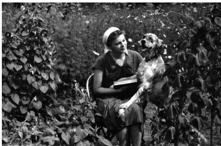
В с. Юрки, 60-ті роки