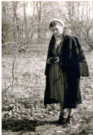
Випускниця Київського університету, 1957