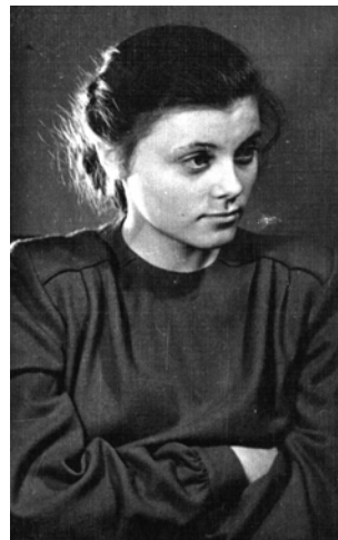
студентка I курсу Київського держуніверситету ім. Т.Г. Шевченка