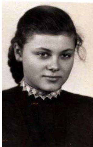
учениця 7-го класу середньої школи № 13 м. Києва